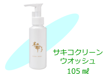
サキコクリーン ウォッシュ 105 ml

◇サキコクリーンウォッシュ(弱酸性洗顔料)は、汚れを落とすだけでなく、紫外線や細菌の侵入を防ぎ、保湿力の高い肌をつくるために考えられた洗顔料です。